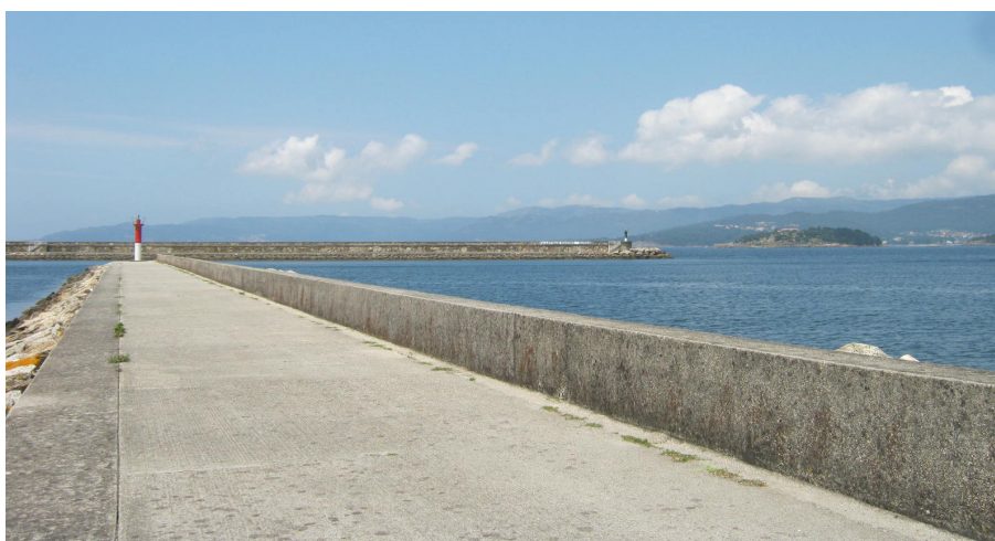
Vista de la entrada al puerto desde el dique auxiliar, dique principal al fondo