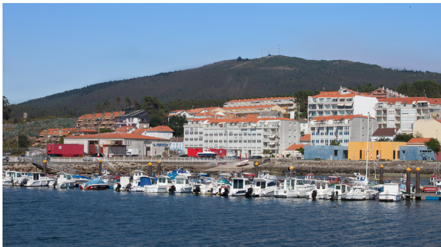
Vista de los pantalanes mixtos desde el muelle pesquero, centro de salud al fondo