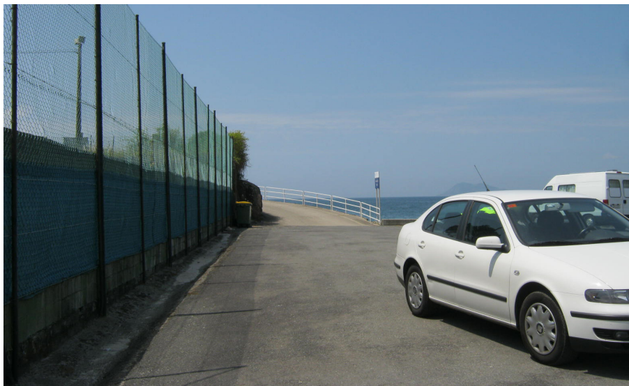
Vista del acceso a la instalación complementaria de Boa