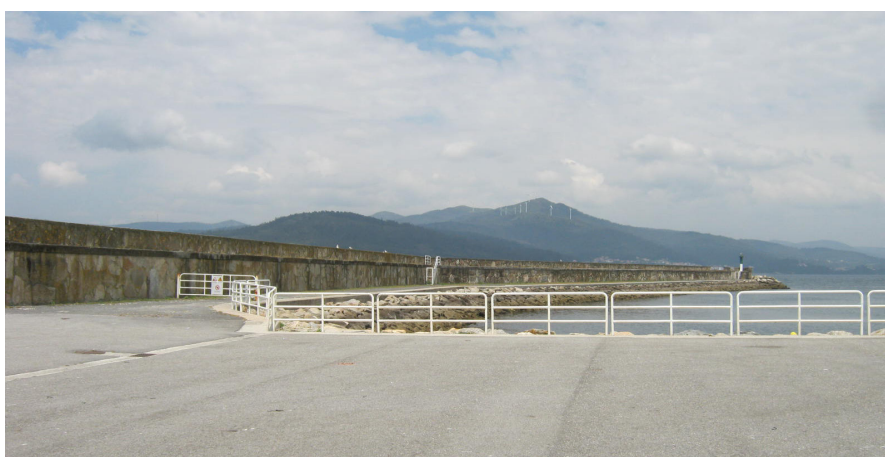
Vista del espaldón del dique desde el final del muelle pesquero