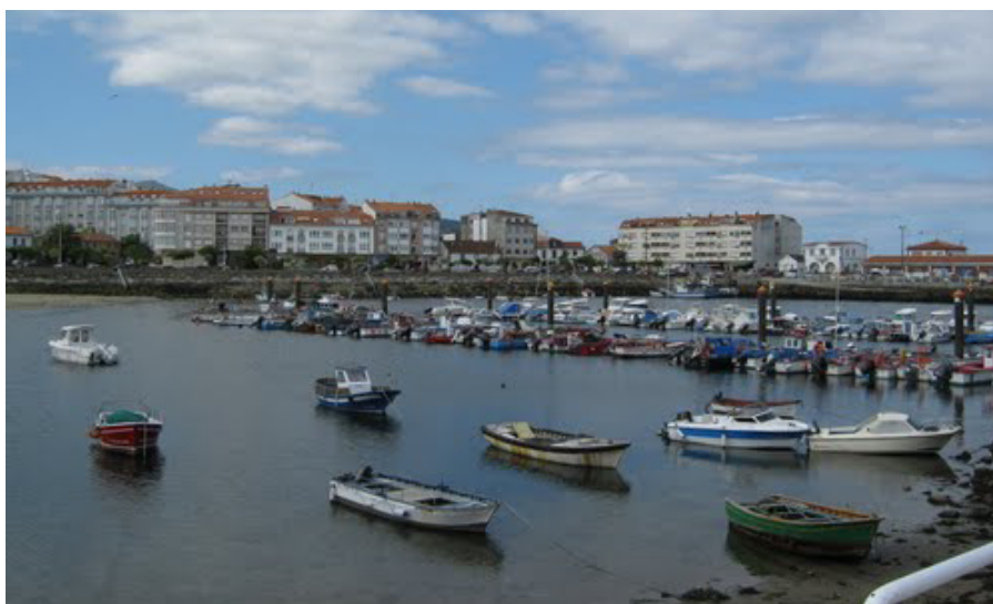
Vista de Portosin desde la explanada de la nave de redes