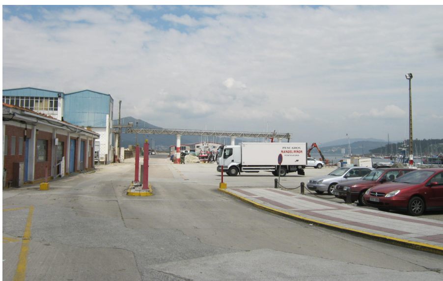
Entrada al muelle pesquero