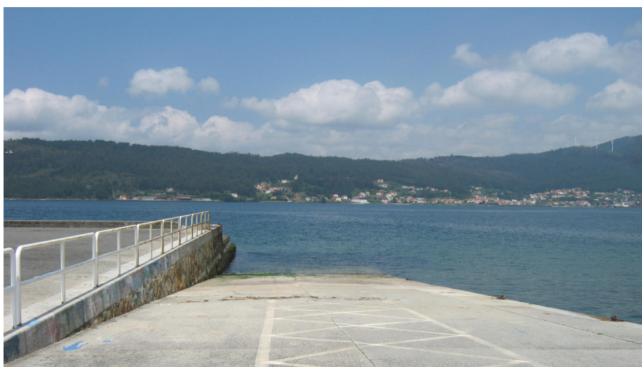
Rampa de la instalación complementaria de Boa