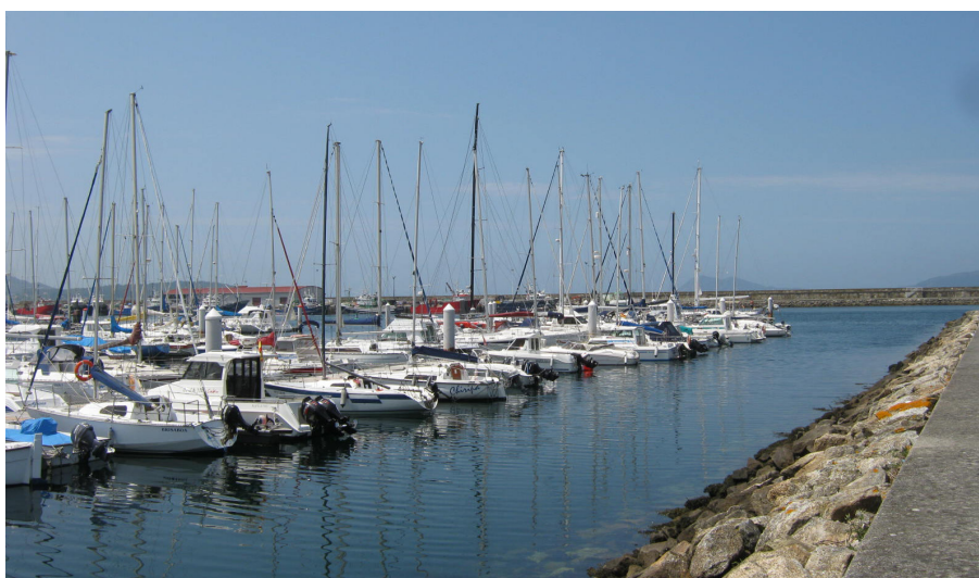
Pantalanes del puerto deportivo desde el dique auxiliar