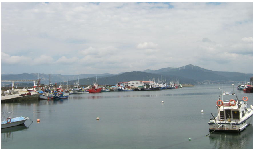
Otra vista del muelle pesquero desde el paseo, con la nueva lonja al fondo.