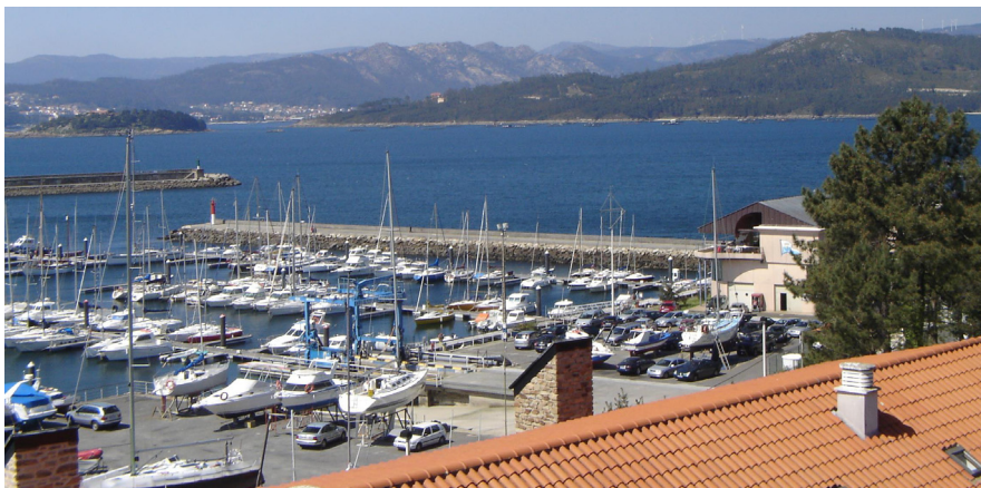
Vista del puerto deportivo, con el edificio del club náutico y los dos diques del puerto