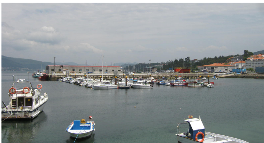
Vista desde el paseo de los pantalaneros mixtos con la nave de redes al fondo.