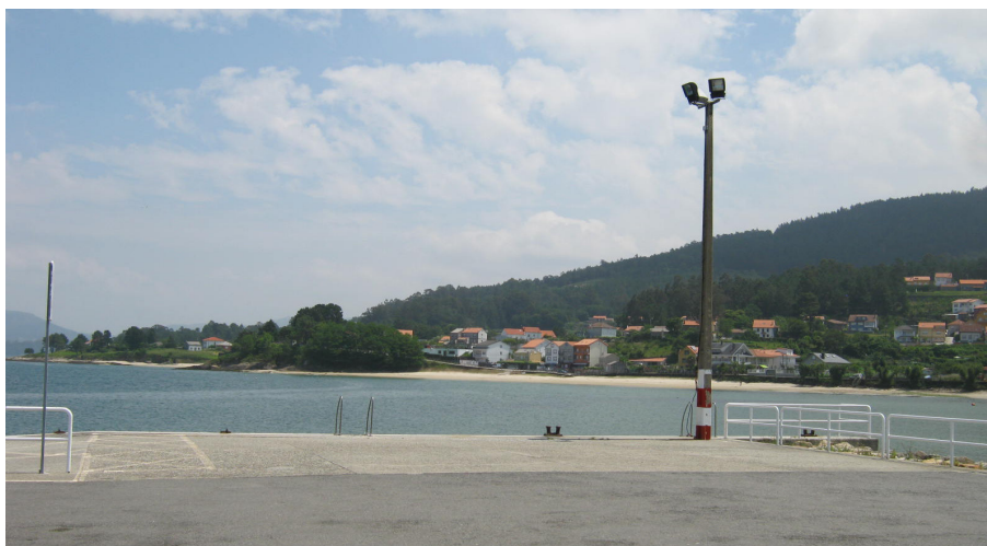
Muelle de la instalación complementaria de Boa