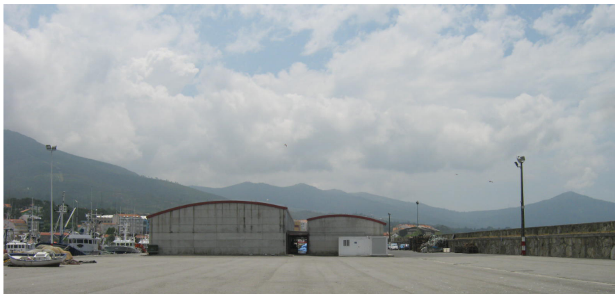
Vista de la lonja desde el final del muelle pesquero