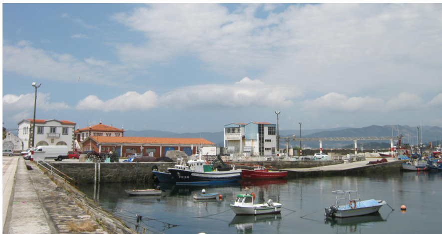
Vista general del muelle pesquero desde el paseo marítimo