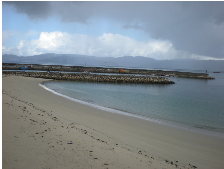
FOTO 1: VISTA DE LA PLAYA DE O SON Y EL DIQUE Y EL CONTRADIQUE DEL PUERTO