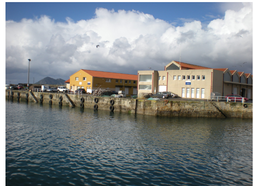
FOTO 24: UELLE ADOSADO AL DIQUE DE ABRIGO. EDIFICACIONES DE LA LONJA Y DEPARTAMENTOS DE USUARIOS