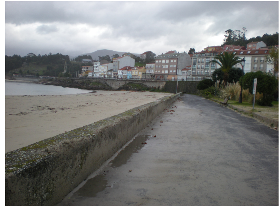
FOTO 11: PLAYA DE O SON Y ZONA DE PASEO DENTRO DE LA ZONA DE SERVICIO PORTUARIA