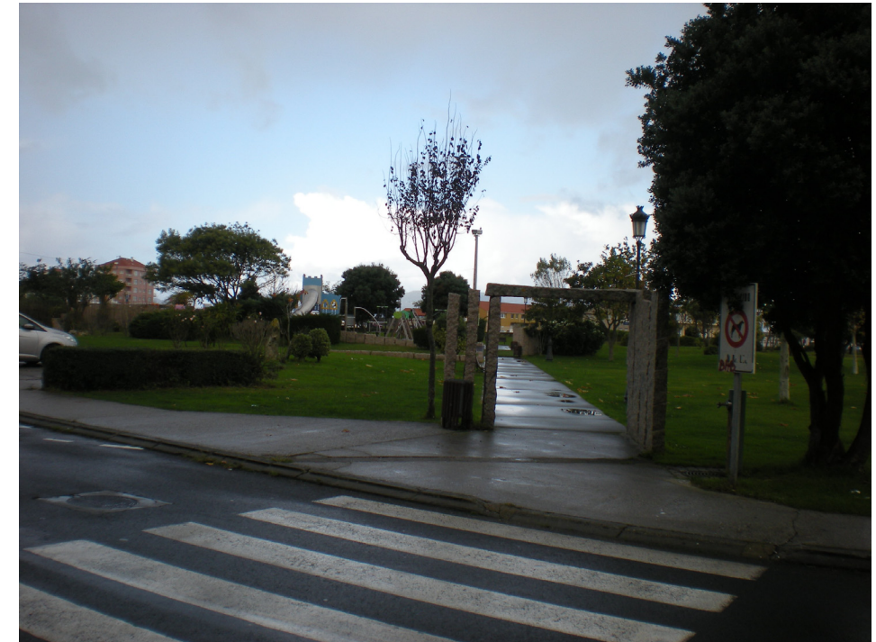
FOTO 7: ACCESO A JARDINES SITUADOS DENTRO DE LA ZONA DE SERVICIO PORTUARIA