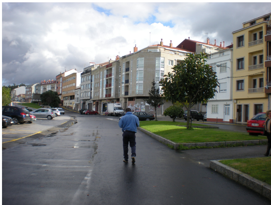
FOTO 26: VIAL DE ACCESO A LA ZONA DE SERVICIO PORTUARIA (AVENIDA DE GALICIA)