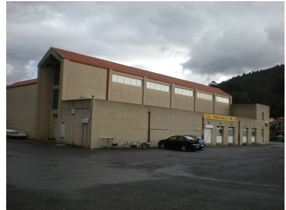
FOTO 43: EDIFICIO DE DEPARTAMENTOS DE USUARIOS ADOSADO A LA LONJA