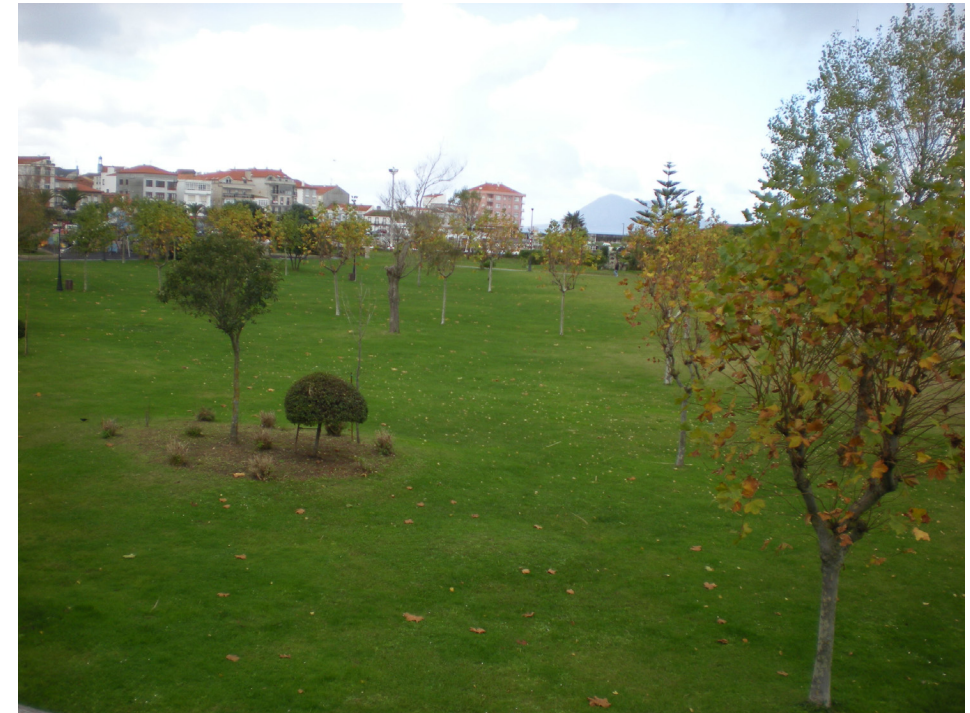
FOTO 3: JARDINES SITUADOS DENTRO DE LA ZONA DE SERVICIO PORTUARIA