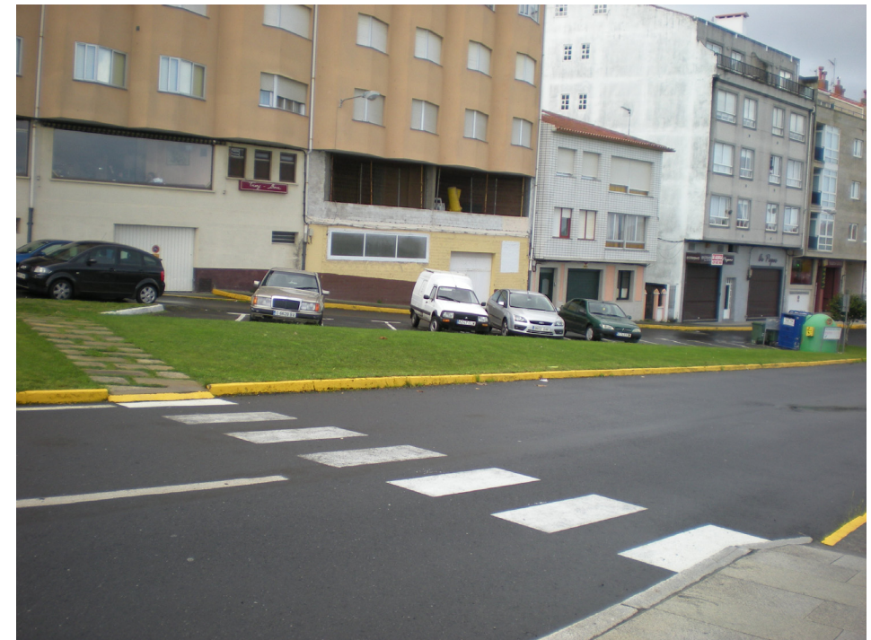
FOTO 4: ZONA DE APARCAMIENTO SITUADA EN LA ZONA DE SERVICIO PORTUARIA