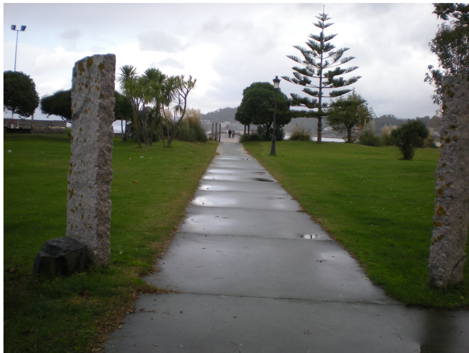
FOTO 10: JARDINES SITUADOS DENTRO DE LA ZONA DE SERVICIO PORTUARIA