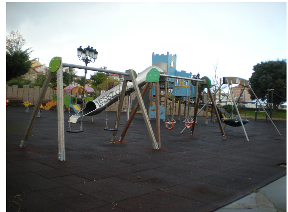
FOTO 8: PARQUE INFANTIL SITUADO DENTRO DE LA ZONA DE SERVICIO PORTUARIA