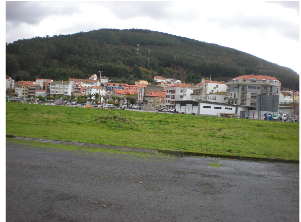
FOTO 39: PARCELA SIN EDIFICAR EN EL MUELLE ADOSADO AL DIQUE DE ABRIGO