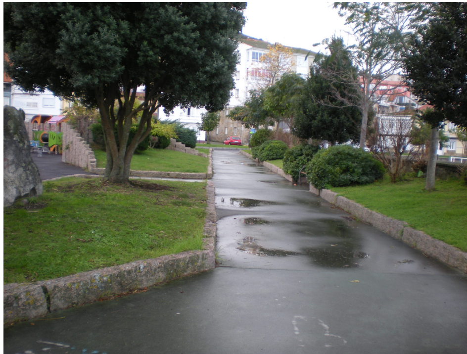
FOTO 9: JARDINES SITUADOS DENTRO DE LA ZONA DE SERVICIO PORTUARIA