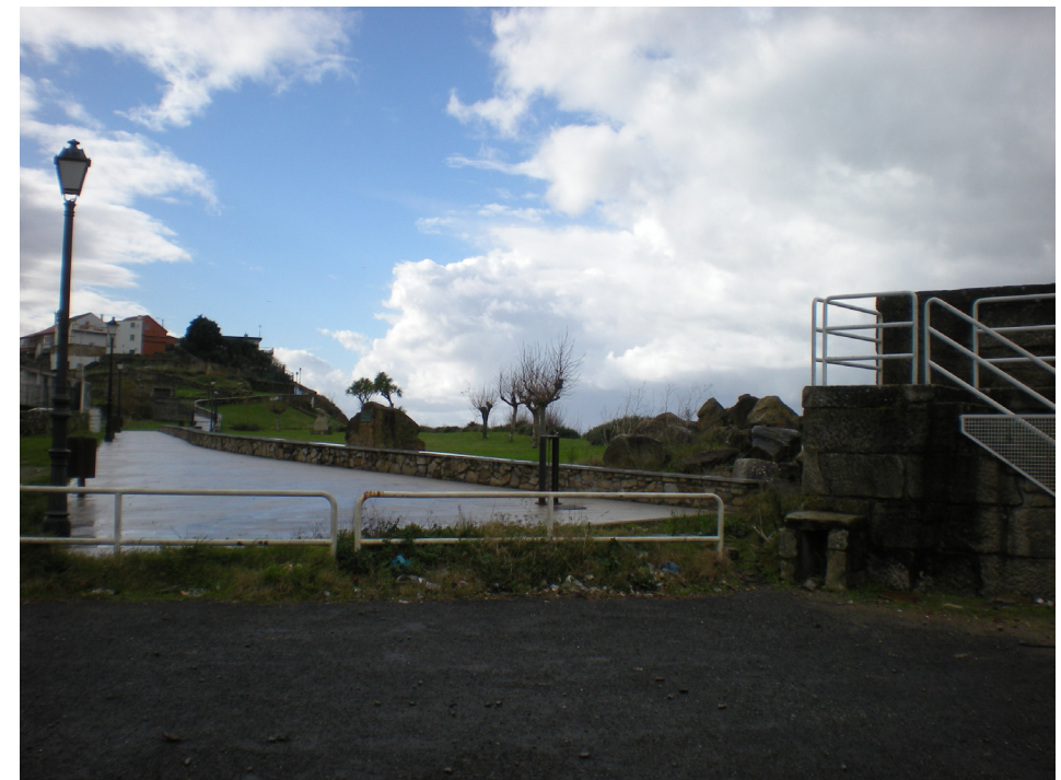
FOTO 36: LÍMITE DE LA ZONA DE SERVICIO PORTUARIA E INICIO DEL PASEO MARÍTIMO