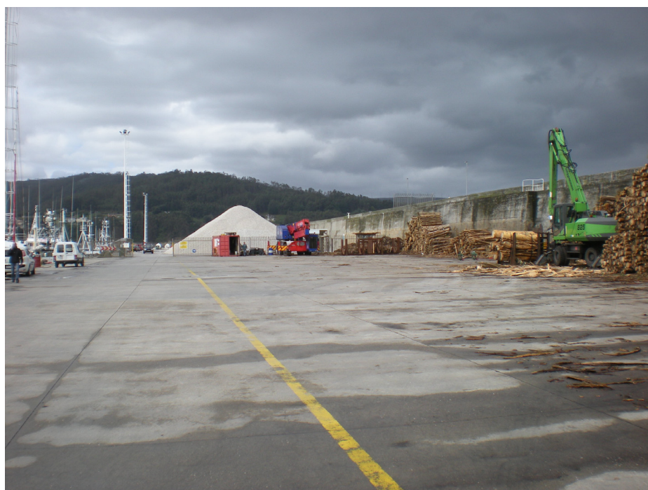
FOTO 42: DIQUE ESTE-OESTE. ÁREA COMERCIAL DE ACOPIO DE MADERA Y CUARZO